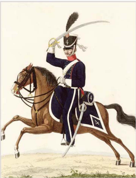
Dragonder te paard.

De oorzaak van deze samenshoring op de Markt lag volgens de garnizoenscommandant van Roermond in de wens van het publiek dat de herbergen met betrekking tot de sluitingstijd dezelfde voorrechten als de sociëteit zouden moeten hebben, vooral met de kermis. Door de drank in een staat van opgewondenheid geraakt had men burgemeester en commissaris bedreigd, hetgeen anders niet was gebeurd. 88